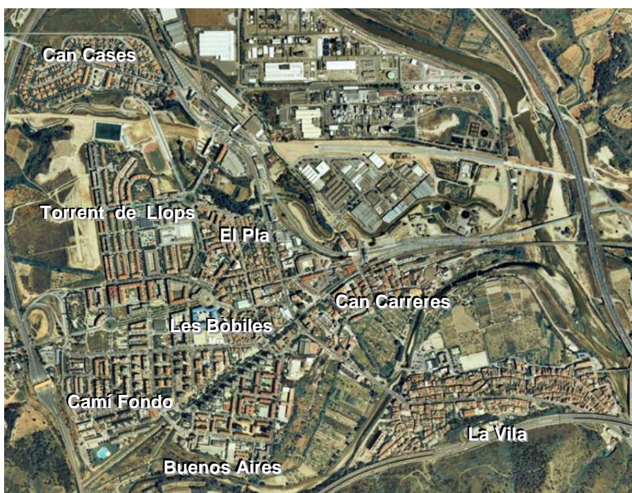
Fotografia aèria de Martorell amb la localització

Segons l'origen de la població podem agrupar-la aproximadament en quatre quarts: els nascuts a Martorell (27.1%), la resta de la província (28.3%), la resta d'Espanya (22.1%) i la resta del món (20.9%). L'any 2011 van haver-hi 383 naixements. Actualment tots els barris estan creixent en població. Hi ha un total de 8.098 llars, de les quals un 15,8% són d'una sola persona, un 30,5% de dues, un 24,0% de tres, un 20,9% de quatre i un 8,6% de cinc o més. Amb una dimensió mitjana de la llar de 2,84 persones per llar ocupada.