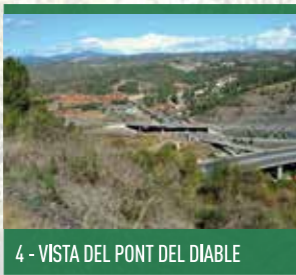
4 - VISTA DEL PONT DEL DIABLE