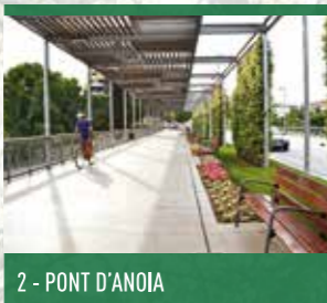
2 - PONT D'ANOIA