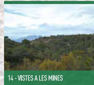
14 - VISTES A LES MINES