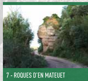
7 - ROQUES D'EN MATEUET