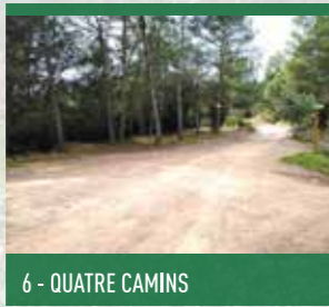
6 - QUATRE CAMINS