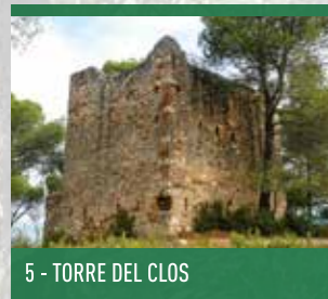
5 - TORRE DEL CLOS