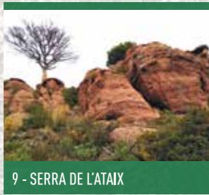
9 - SERRA DE L'ATAIX