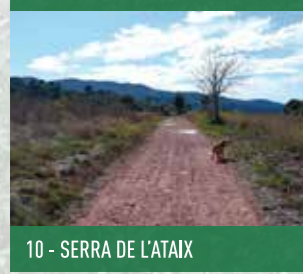
10 - SERRA DE L'ATAIX