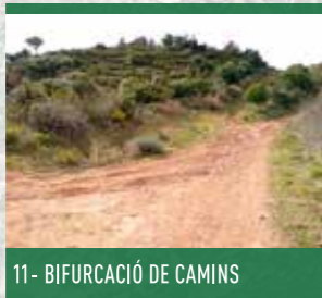
11 - BIFURCACIÓ DE CAMINS