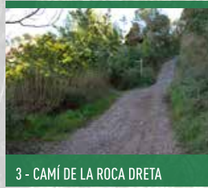
3 - CAMÍ DE LA ROCA DRETA