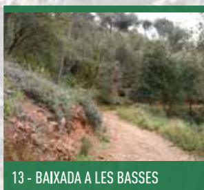
13 - BAIXADA A LES BASSES