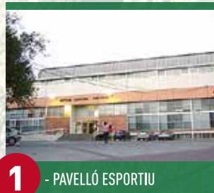
1 - PAVELLÓ ESPORTIU