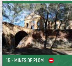
15 - MINES DE PLOM